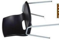
MIC 6 (VEU)