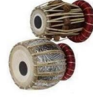
MIC 12 (TABLA R)