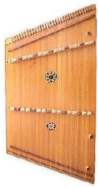
MIC 5 (SALTIRI)