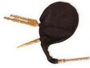
MIC 8 (CORNAMUSA BORDÓ)