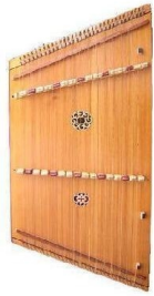
MIC 5 (SALTERIO)