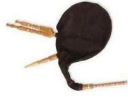
MIC 8 (GAITA BORDON)