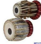
MIC 12 (TABLA R)