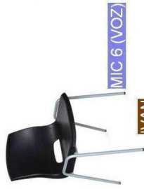
MIC 6 (VOZ)